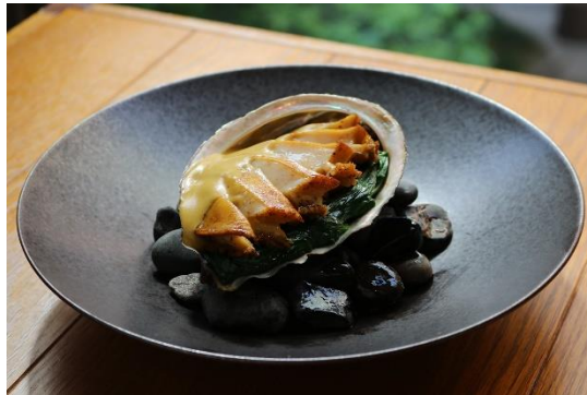
玄海産鮑のバターソテー 肝ソース +6,612 (8,000) Sautéed Genkai Sea abalone, abalone liver sauce, butter +6,612 (8,000)