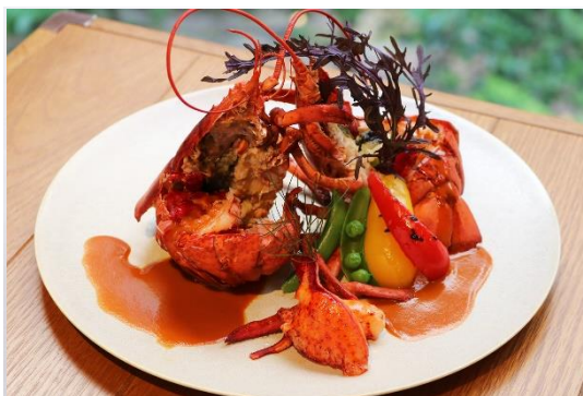
オマール海老の白ワイン蒸し アメリケーヌソース グリルドベジタブル +1,653 (2,000) Steamed lobster with white wine, sauce Américaine, grilled vegetables +1,653 (2,000)