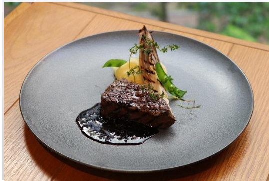
伊万里牛 サーロインまたはフィレ (80g) +3,306 (4,000) Imari beef, Sirloin (80g) or Tenderloin (80g) +3,306 (4,000)