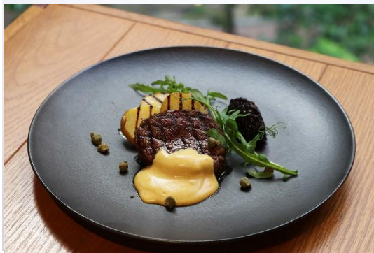
オーストラリア産牛フィレ肉のグリル マスタードソース オニオンの赤ワイン煮添え Grilled Australian beef tenderloin, mustard sauce, onion stew, red wine