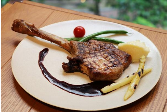
糸島豚のグリル 赤ワインソース +1,653 (2,000) Grilled Itoshima pork, red wine sauce +1,653 (2,000)