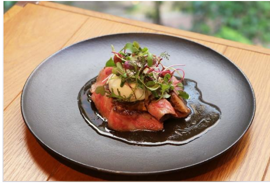
国産牛サーロインの炙り焼き コンソメソース ポーチドエッグ +1,653 (2,000) Seared beef sirloin, consommé sauce, poached egg +1,653 (2,000)