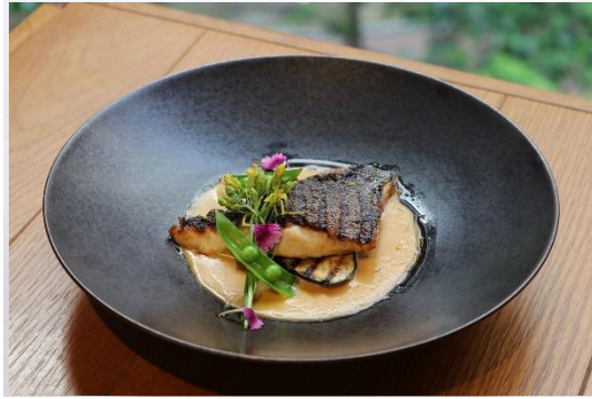
本日の鮮魚 シェフお勧めソース Today's Market fish, Chef recommended sauce